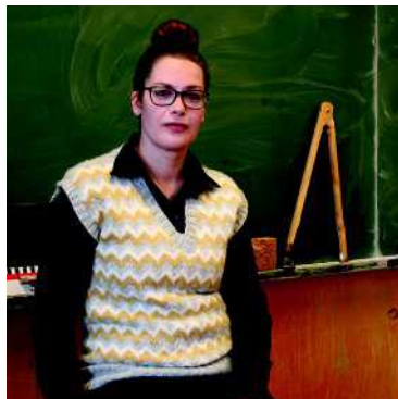
Rehtori- slipoveri 146