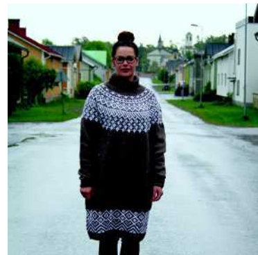
Kirkkokatu- neulemekko 152