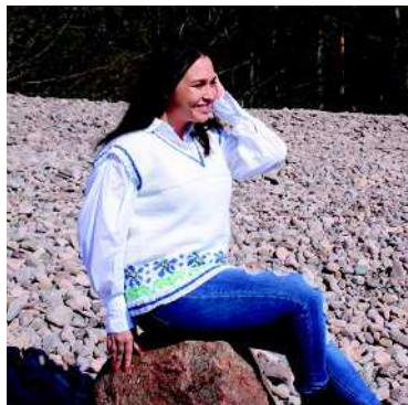
Lemmikki- slipoveri 140